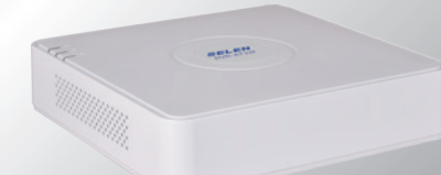
ハードディスクレコーダー DVR-AT32F NEW